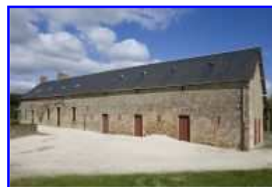
Vue de trois-quarts vers le nord-est.

Partie(s) constituante(s) non étudiée(s) : étable ; grange