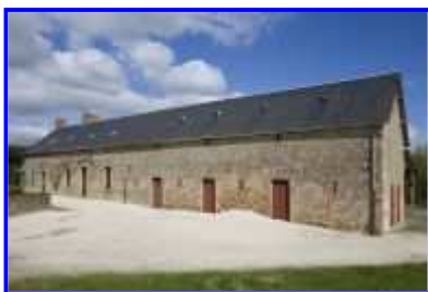
Fig. 4 Vue de trois-quarts vers le nord-est.