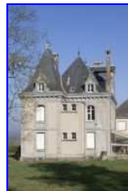
Fig. 15 Logis : élévation latérale droite.