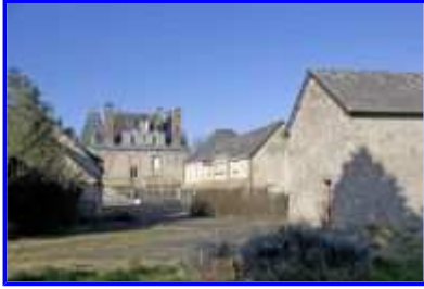
Fig. 22 Logis et bâtiments aménagés pour la maison de retraite.