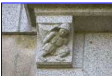
Fig. 13 Logis, élévation antérieure, détail : le vendangeur.