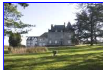
Vue d'ensemble vers l'est.

Partie(s) constituante(s) non étudiée(s) : communs ; dépendance ; chapelle