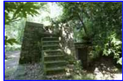
Fig. 27 Forêt : la tour carrée, vue vers l'ouest.