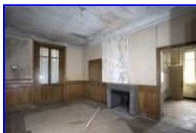
Fig. 20 Salon à gauche du hall d'entrée, vue vers le nord-est.