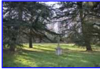
Fig. 23 Parc : calvaire.