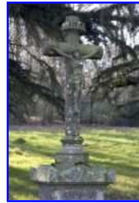
Fig. 24 Parc, calvaire, détail : Christ en croix.