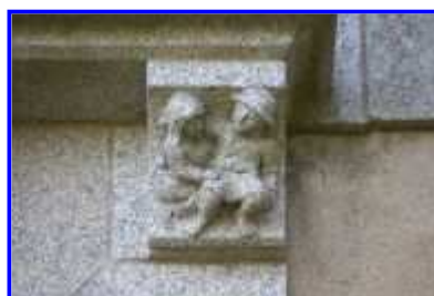
Fig. 14 Logis, élévation antérieure, détail : le couple de paysan.