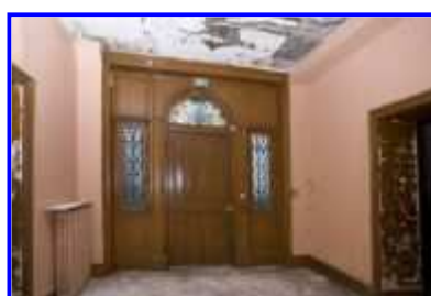
Fig. 17 Hall d'entrée : vue vers l'ouest.