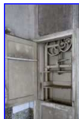
Fig. 21 Cuisine : monte-plats.