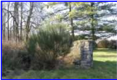
Fig. 25 Parc : banc courbe en maçonnerie.