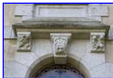
Fig. 12 Logis, élévation antérieure, détail : décor sculpté au-dessus de la porte d'entrée.