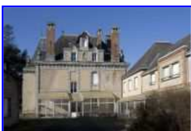
Fig. 16 Logis : élévation postérieure.