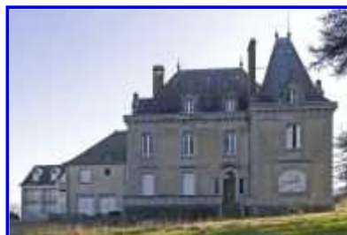
Fig. 11 Logis : élévation antérieure.