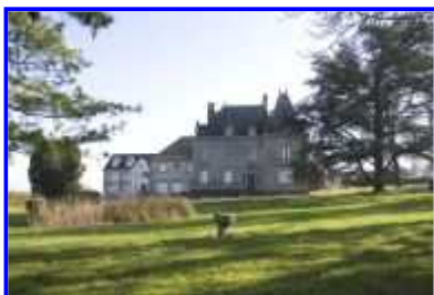
Fig. 10 Vue d'ensemble vers l'est.