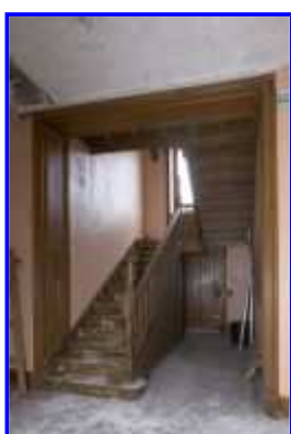
Fig. 19 Hall d'entrée : départ de l'escalier.