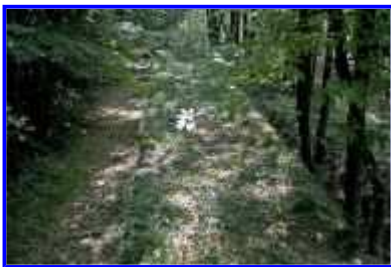
Fig. 28 Forêt : la tour carrée, vue de dessus du mur attenant.