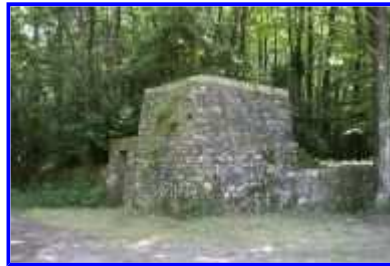
Fig. 26 Forêt : la tour carrée, vue vers le nord-est.