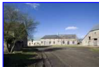
La Haute-Morinière, vue partielle vers le sud-ouest.