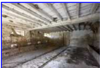
Fig. 16 La Haute-Morinière, étable-grange, vue intérieure de l'étable.