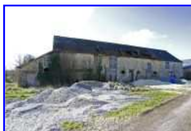
Fig. 8 La Basse-Morinière, étable-écurie-grange, vue vers le sud.