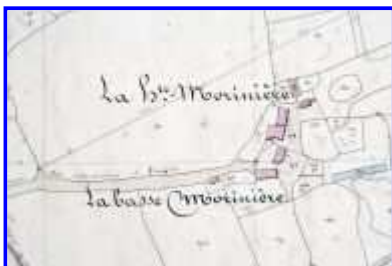
Fig. 1 Extrait du plan cadastral de 1842, section F.