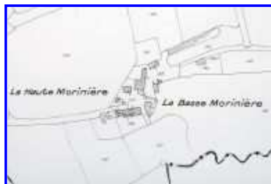
Fig. 2 Extrait du plan cadastral de 1982, section F.