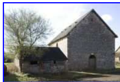
Fig. 15 La Haute-Morinière, poulailler et étable-grange, vue vers le sud.