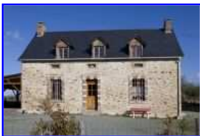
Fig. 7 La Basse-Morinière, logis probable de la ferme, vue vers le nord.