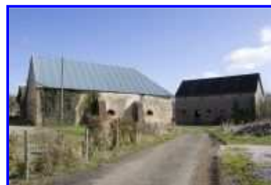
Fig. 12 La Haute-Morinière, vue partielle vers le nord-est.