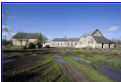
Fig. 10 La Haute-Morinière, vue d'ensemble vers l'est.