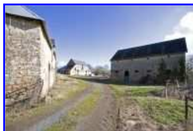
Fig. 11 La Haute-Morinière, vue partielle vers le nord.