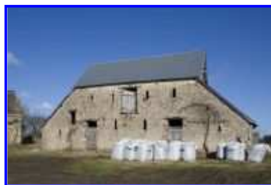
Fig. 14 La Haute-Morinière, porcherie-écurie-grange, vue vers le nord-ouest.