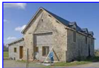
Fig. 9 La Basse-Morinière, remise-aire à battre en cours de transformation en logis, vue vers le sud-ouest.