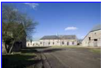
Fig. 13 La Haute-Morinière, vue partielle vers le sud-ouest.