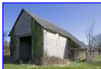
Fig. 18 La Haute-Morinière, remise-aire à battre, vue vers l'est.