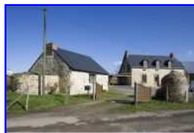
Fig. 6 La Basse-Morinière, fournil et logis probable de la ferme, vue vers le nord.