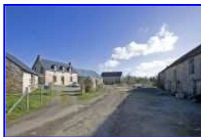
Fig. 5 La Basse-Morinière, vue partielle vers l'est.