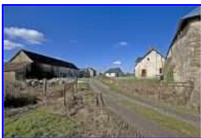
Fig. 4 La Basse-Morinière, vue d'ensemble vers le sud-ouest.