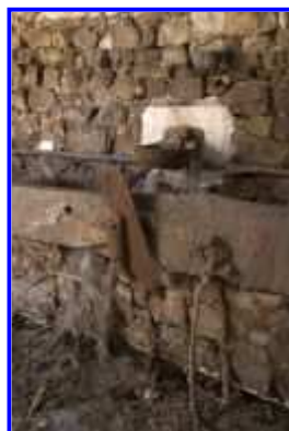
Fig. 17 La Haute-Morinière, étable-grange, vue intérieure de l'étable, détail : crèche et abreuvoir automatique.