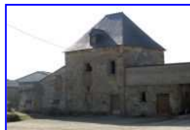
Logis à pavillon : vue de trois-quarts vers le sud-ouest.